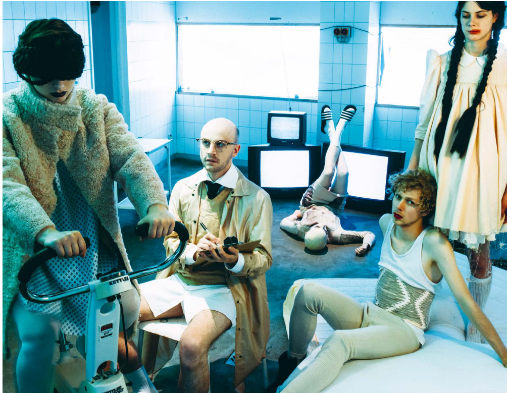
Kostüm: Irina Spreckelmeyer

Der Studiengang Szenografie – Kostüm – Experimentelle Gestaltung wird in Vollzeit studiert: mit acht Semestern Regelstudienzeit einschließlich der Praxisphase/Auslandssemester und der Anfertigung einer Bachelorarbeit.